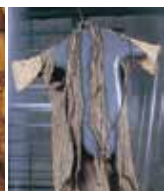
沖縄戦当時の住民の着物