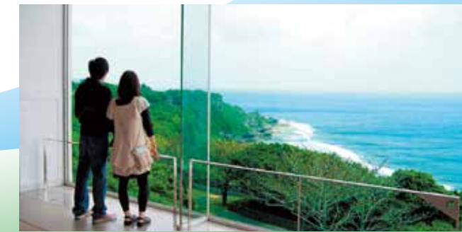
太平洋の大海原と打ち寄せる白波、青く広がる空の美しい景観にいやされる。