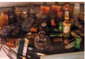
壕等から発見された医療器具

沖縄戦において、日米両軍は総力をあげて死闘をくり広げた。米軍は物量作戦によって空襲や艦砲射撃を無差別に加え、おびただしい数の砲弾を打ち込んだ。この『鉄の暴風』は、およそ3ヶ月に及び、沖縄の風景を一変させ、軍民20数万の死者を出す凄まじさであった。