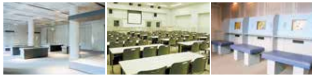
■企画展示室（1階） 255㎡の広さで展示ケース、展示パネルを備えており、写真展や絵画展などにご利用になれます。 ■会議室（2階） 教室形式で、100名程度収容できます。 ■クイズコーナー（1階） 利用者がモニター画面に触れ、沖縄に関するさまざまなクイズに答えます。