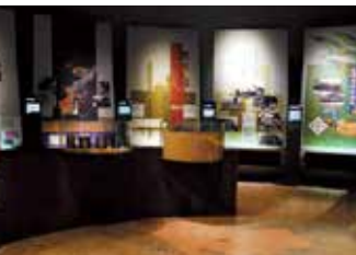
琉球処分から沖縄戦直前まで時系列に沿って展示

明治政府は、琉球王府に対して武力を背景にした『琉球処分』を断行した。そこで、沖縄県は皇民化政策によって急速に日本化を進めた。一方、近代化を急ぐ日本は、富国強兵策により軍備を拡張し、近隣諸国への侵出を企てた。満州事変、日中戦争、アジア・太平洋戦争へと拡大し、沖縄は、15年戦争の最後の決戦場となった。