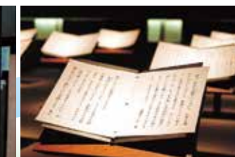
戦争体験の証言 145名(155件)の証言