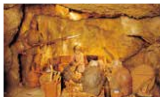
ガマの中に避難している住民、子どもの泣き声もれないように口を押さえる母親、そして威嚇する日本兵。

日本守備軍は首里決戦を避けて南部へ撤退し、出血持久作戦をとった。その後、米軍の強力な掃討戦により追いつめられ、軍民入り乱れた悲惨な戦場と化した。壕の中では、日本兵による住民虐殺や、強制による集団死、餓死があり、外では米軍による砲爆撃、火炎放射器などによる殺戮があってまさに阿鼻叫喚の地獄絵の世界であった。