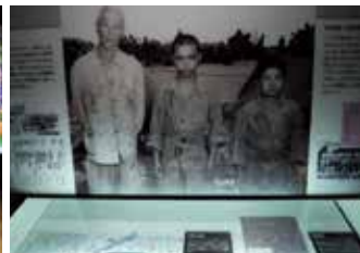
幼さが残る少年や老人も戦闘へ参加、米軍の捕虜となる。