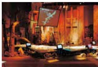
大型スクリーンに映し出される沖縄戦の様子