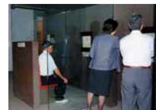
証言映像ブース 約1,000件の証言映像 (英文対応)