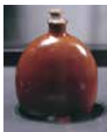
沖縄戦当時の水が入った水筒