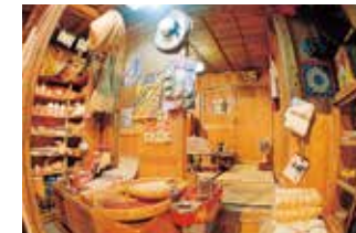
商店(マチャグラー)の内部

沖縄の戦後は収容所から始まった。その後、米・ソを軸とした冷戦構造の中で軍事基地として強化されていく沖縄。土地を奪われ、さまざまな抑圧を受けてきた住民の怒りは、島ぐるみの土地闘争や復帰運動へと広がっていく。東西冷戦が終わった今もなお、世界各地にくりひろげられる民衆の悲劇。沖縄の教訓は、「平和の要石」を通して世界へ発信される。