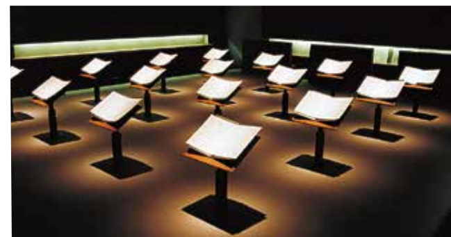
沖縄各地、疎開先、移民した国々での戦争体験証言の部屋。証言映像もご覧になれます。

沖縄戦の実相を語るとき、物的資料になるものは非常に少ない。無念の思いで死んでいった人たちを代弁できるものは、戦場で体験した住民の証言しかない。忘まわしい記憶に心を閉ざした人々の重い口から、後世に伝えようと語り継がれる証言の数々は、歴史の真実そのものである。