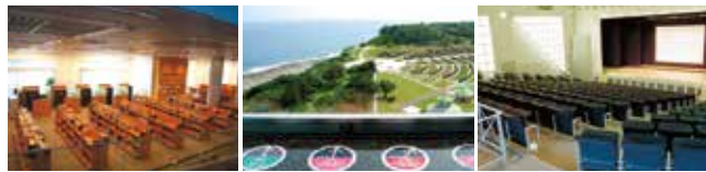
■情報ライブラリー（1階） ■展望室 ■平和祈念ホール（1階） 230名程度収容できます。

数多くの図書・雑誌を閲覧できるほか、AVブースでは戦争体験者の証言や平和に関するビデオ等もご覧になれます。また、中央の検索コーナーでは、パソコンの簡単な操作で資料館に収蔵されている多くの収蔵品や図書文献の情報、展示室の解説情報、平和学習の教材など、多様な情報を誰にでも簡単に手に入れることができます。