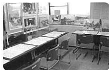
沖縄戦の写真パネルと証言本展示