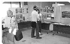
砲弾など実物資料と展示パネル

「沖縄県平和祈念資料館ってなに?」、「何がみられるの?」、「資料はどのように保管されているの?」、「どんな事業を行っているの?」のコーナーに分け、博物館事業における展示、教育普及、調査・研究、資料収集・保存活動の4本柱を説明しました。また、これまで刊行してきた出版物、貸出用の沖縄戦写真パネル、水筒や鉄カブトなどの実物資料、当館で最も大切な住民の証言本も展示しました。来室者数約300人。シンプルな分、スタッフの補足説明が求められました。当館を知らない県民を発掘し、周知する絶好の機会になりました。次年度は受託事業の成果や展示スペース、内容とも拡充したいものにしたものです。