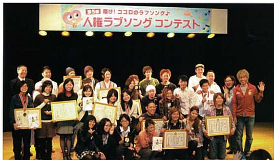
沖縄県平和祈念資料館の充実宣言2009 —感動する資料館活動のために—

2010年は新館開館10周年、旧館から数えると35年の節目の年です。人口の7割が戦後生まれに占められ、戦争体験者の高齢化は進み、貴重な体験そのものが消えつつある戦後65年目を迎えることとなります。そのような時節に、当館の過去と現在の諸活動の総点検を行い、また未来を展望する重要な年と位置づけ、「充実宣言2009」を掲げました。この宣言では、職員が資料館の社会的役割や存在意義を常に意識し、事業推進にあたり県民をはじめ内外の来館者のニーズに応え、その満足度を高め、感謝されることをめざすものです。さて宣言の内容は、問題解決の実現へ向けての確信と姿勢を表明した「できます(宣言)」でまとめました。