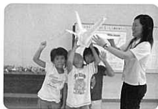
完成した巨大折り鶴と子どもたち

また、8月16日(土)には、終戦記念日にあわせた催しとして、平和メッセージを書き込んだ巨大折り鶴を作る等の参加型コーナーを設置し、たくさん子どもたちが、戦争マリアア犠牲者数や平和について考える日となりました。