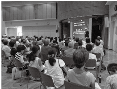
③平和を語る市民のつどいの様子