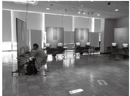
①川崎市平和館展示の様子