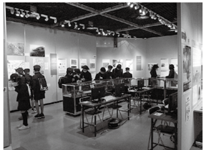
②大阪国際平和センター展示の様子