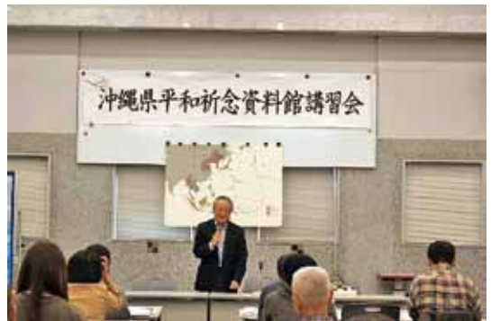
昨年度の資料館講習会の様子

今年度は令和2年3月11日（水）に開催を予定していましたが、県内においても新型コロナウイルス感染者が確認され、今後の感染拡大を予防するために、講習会開催を延期しました。新たな講習会の日程については、後日、当館ホームページや公式Twitterによりお知らせいたします。