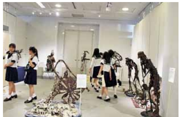
熱心に観る県外の高校生