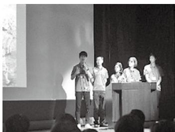
シンポジウムでの発表