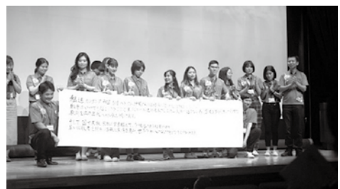
シンポジウム共同宣言発表の様子