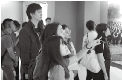
ひめゆり平和祈念資料館見学