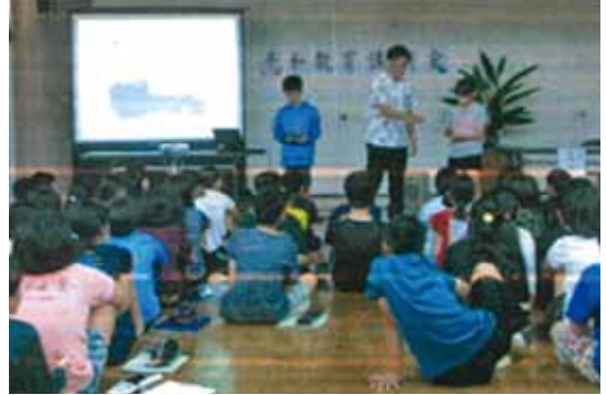
小学校における平和講話の様子