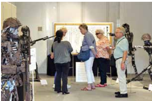
海外からの観覧者に説明する学芸員