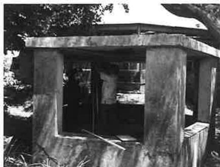
本部監視哨跡(本部町)