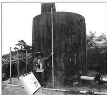
痕が残る給水タンク(名護市:愛楽園内)

今回の企画展を実施するにあたり、約10年ぶりに沖縄島北部で戦争遺跡等の調査を実施いたしました。戦争遺跡の中には、文化財として保護され平和学習の場として活用されている遺跡もありましたが、開発や崩落により埋没・消失したとみられる遺跡もありました。今回の企画展では、戦争遺跡の写真とともに、一部の遺跡については、より伝わりやすくするために図面や模型を作成して展示しています。ご覧頂ければ幸いです。