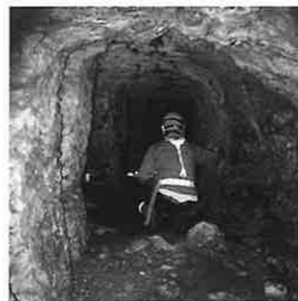
源河大湿帯の御真影奉護壕跡(名護市)