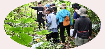
昨年度石垣島受講者