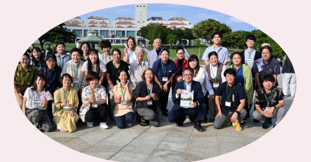
昨年度沖縄本島受講者